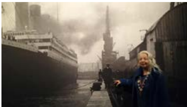
Une résidente attend au port avant d'embarquer pour la visite du Titanic.

Alain Métrailler - Assistant socio-éducatif