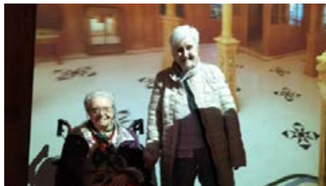
Deux résidentes s'imprègnent de l'ambiance du grand salon virtuel du Titanic.