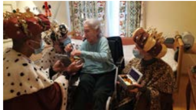
EMS Meillerie : pour l'Épiphanie, visite des Rois mages avec leurs coffres remplis de surprises.