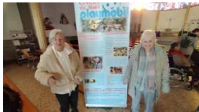
EMS L'Oriel : à l'occasion des fêtes de fin d'année, les habitants sont allés à Morges découvrir une crèche de Noël faites 100% en Playmobil.