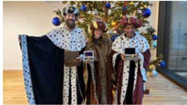
EMS La Rozavère : les trois Rois mages lors de leur tournée de l'Épiphanie devant le grand sapin de l'interface.