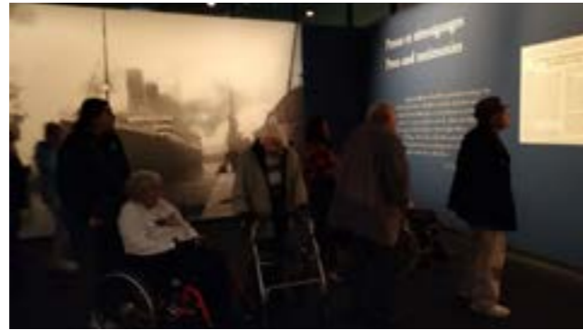
EMS La Rozavère : les habitants ont été immergés dans l'histoire du Titanic en allant à l'exposition de Beaulieu.