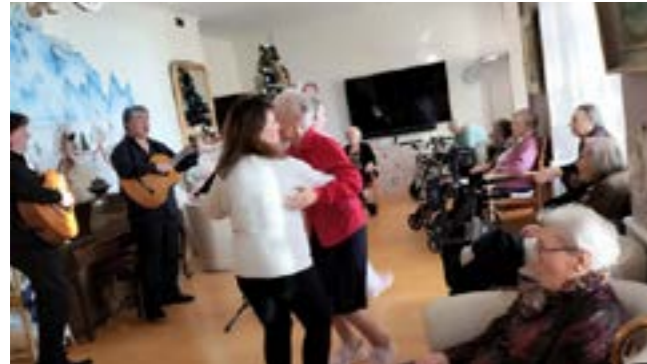
EMS Meillerie : la danse, un vrai bonheur qui nous fait du bien, au corps comme à l'esprit.