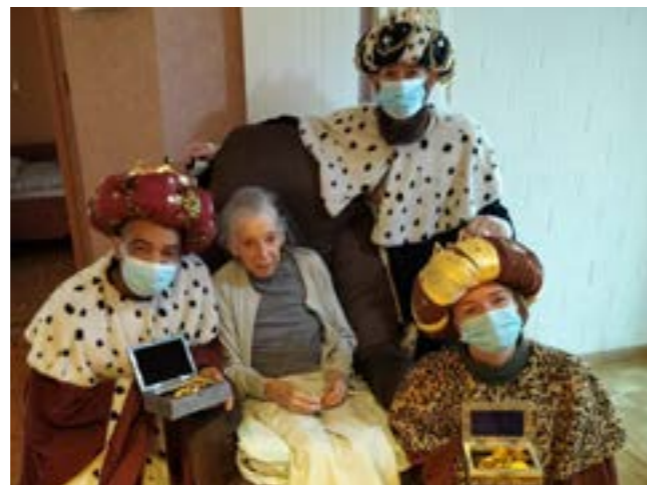
EMS L'Oriel : une habitante de L'Oriel, entourée des trois Rois mages à la lumière de l'Épiphanie.