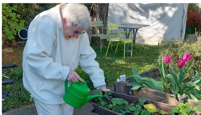
EMS Meillerie : les fraisiers ont soif.