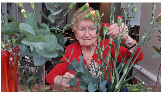
EMS Meillerie : du travail et du plaisir, pour embellir le quotidien.