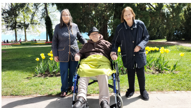
EMS L'Oriel : trois résidents se rendent à la fête de la tulipe à Morges et le soleil est de la partie.