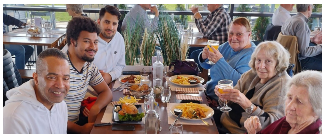
EMS La Rozavère : sortie restaurant à l'aérodrome de la Blécherette.