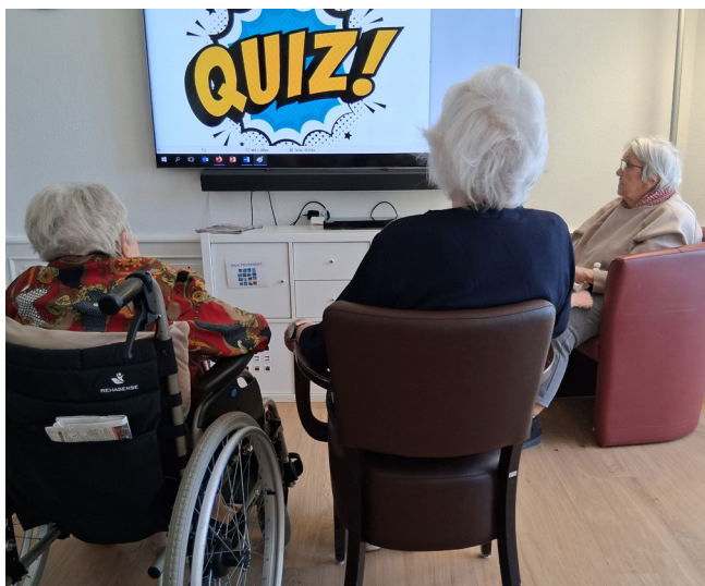
Trois résidentes participent à un quizz sur la culture générale.