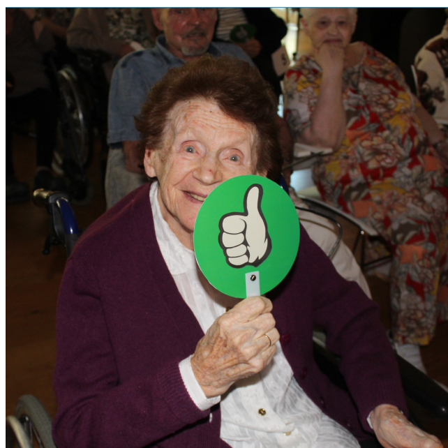
Habitante en plein vote après une prestation de l'un des 4 pays concourant cette année.