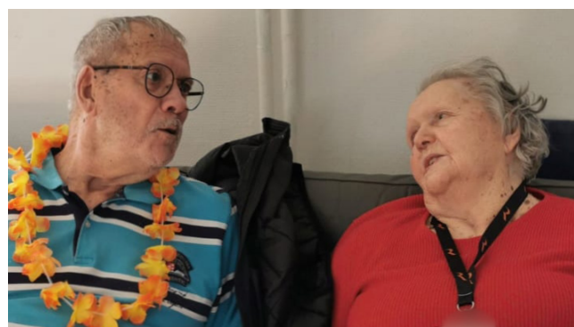
Un membre du comité d'accueil en train d'accueillir un nouvel habitant.