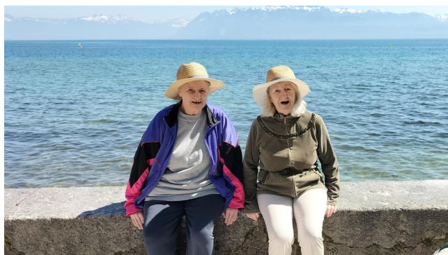
EMS L'Oriel : deux résidentes prennent du bon temps et rigolent au bord du lac Léman.