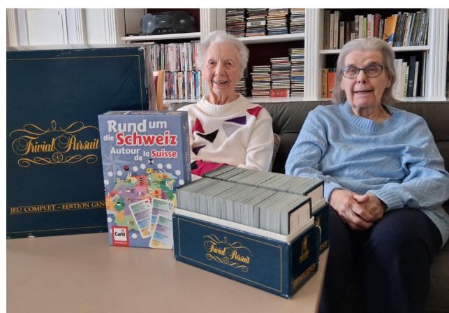
Deux résidentes répondent aux questions du Trivial poursuite sur le thème de la Suisse.